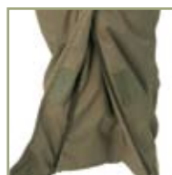
Клапан внизу полукомбинезона.