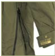
Боковые молнии куртки.