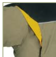
Удобный крой костюма.