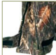
Клапан внизу полукомбинезона.