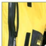
Карман для мобильного телефона.