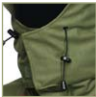
Удобный регулируемый капюшон.