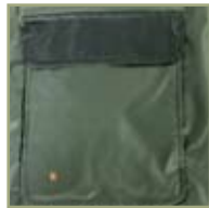
Карманы с клапанами.