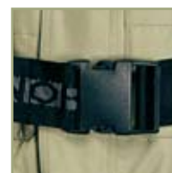
Надежный замок полукомбинезона.