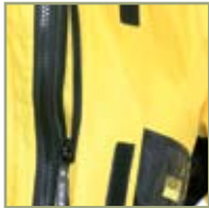
Карман для мобильного телефона.