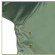
Дополнительная вентиляция куртки.