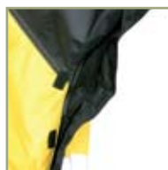
Дополнительная вентиляция куртки на молнии.