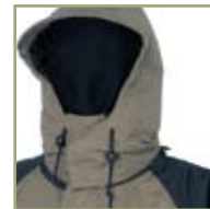
Удобный регулируемый капюшон.