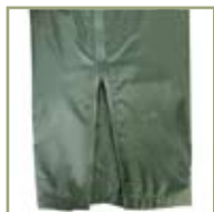
Застежки-молнии с клапанами.