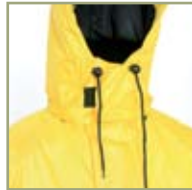
Удобный регулируемый капюшон.