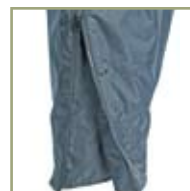
Застежка-молния внизу комбинезона.