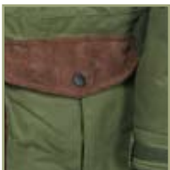
Карман с отделением для патрона.