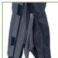
Застежка-молния внизу штанов с клапаном на «липучке».