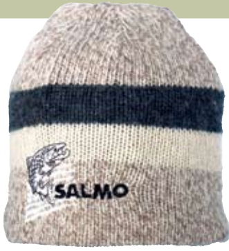
Шапка Salmo WOOL