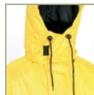
Удобный регулируемый капюшон.