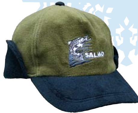
Шапка Salmo Pilot