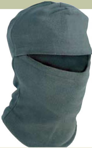
Шапка-маска Salmo MASK