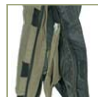
Застежка-молния внизу штанов с клапаном на «липучке».