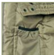
«Теплый» карман для мобильного телефона.