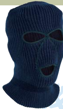
Шапка-маска Salmo KNITTED