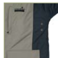
Дополнительная вентиляция куртки.