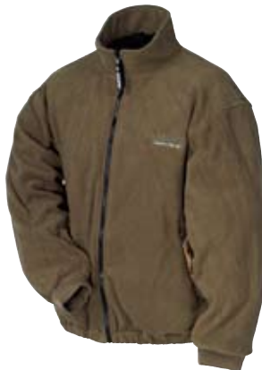
Отстегивающаяся внутренняя куртка.