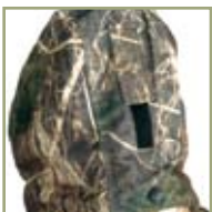
Регулятор глубины капюшона.