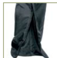
Застежка-молния внизу штанов.