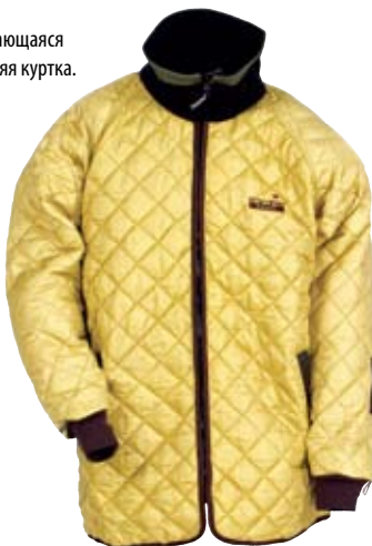
Отстегивающаяся внутренняя куртка.