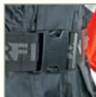
Надежный поясной замок.