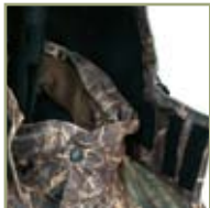
Удобный регулируемый капюшон.