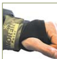
Эластичные удлиненные утепленные манжеты.