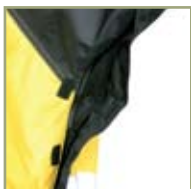
Дополнительная вентиляция куртки на молнии.