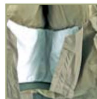
Внутренняя снегозащитная юбка.