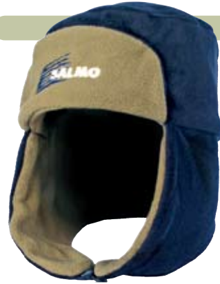
Шапка-ушанка Salmo PILE CUP