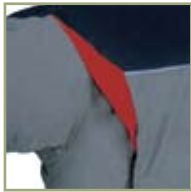
Удобный крой костюма.