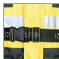
Надежный поясной замок.