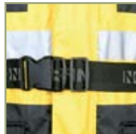
Надежный поясной замок.