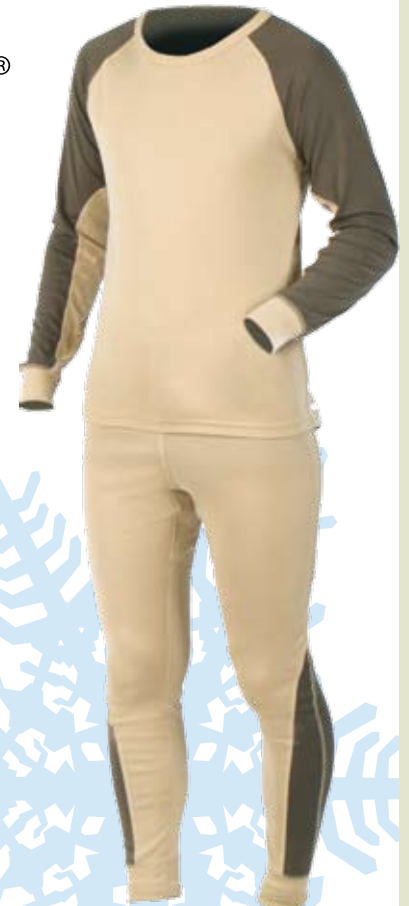
Термобелье NORFIN THERMO LINE

Нижнее тонкое раздельное термобелье. Надевается на голое тело. Может использоваться для повседневной носки в прохладную погоду. Изготавливается двух расцветок.